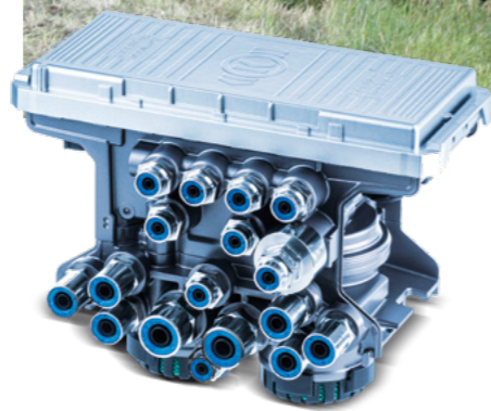
Rieck transportiert für Knorr-Bremse Einzelteile für Nutzfahrzeuge quer durch Europa